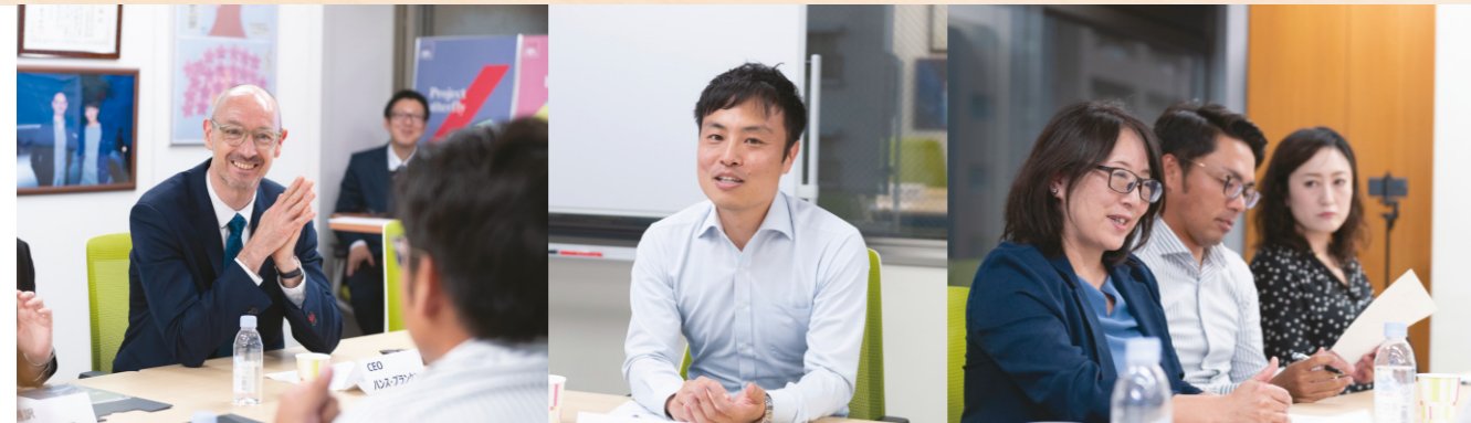
アクサ損害保険本社にお客さまをお招きしての座談会の様子です。 お客さまと直接交流し、さまざまな意見交換をさせていただき貴重な場となりました。

日頃よりアクサ損害保険をお引き立て賜り、誠にありがとうございます。本ディスクロージャー誌をお届けするにあたり、ご挨拶申し上げます。