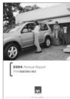
ディスクロージャー資料

商品および企業情報：自動車保険の資料請求やお見積りを依頼されたお客様には、商品パンフレットと重要事項説明書を、ご契約された方には約款のほか、事故や故障の際のサービス内容について記載したサービスガイドを送付し、お客様が常に適切に情報を得られる体制作りをしております。このほかに、会社の業績や経営についての情報提供としてディスクロージャー資料を毎年編纂しております。