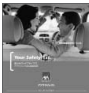
商品パンフレット