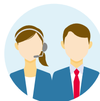
アクサダイレクト

*2021年4月1日以降始期の二輪・原付バイクのご契約については ケース3 の場合でもSTEP2-1を参照ください。