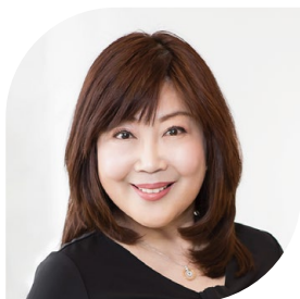
公益社団法人 顔と心と体研究会 理事長 フェイシャルセラピスト・歯学博士

交通事故をはじめ、外面的・内面的な傷に対するケアについて幅広いテーマを取り扱います