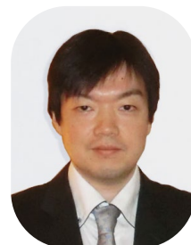
日本医科大学 形成外科学 主任教授