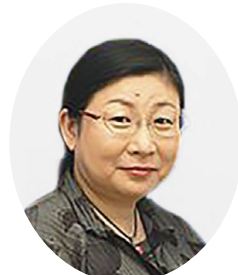
若松町ところとひふのクリニック PCIT研修センター長