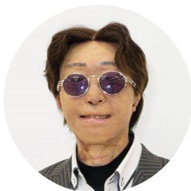
オープンハートの会 会長